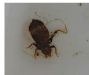
サナエトンボ(ヤゴ)