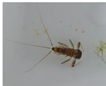
タニガワカゲロウ