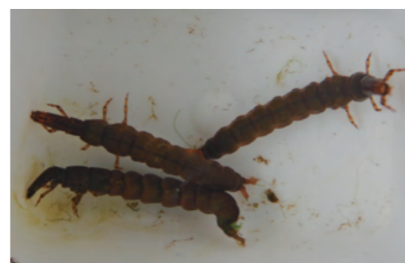
ヒゲナガカワトビケラ