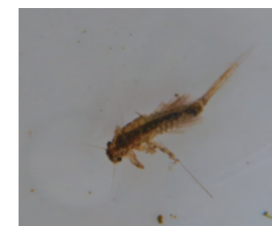
キイロカワカゲロウ