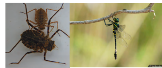
コヤマトンボ(ヤゴ)