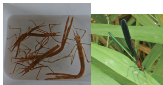
ハグロトンボ(ヤゴ) → 成虫

カワムツは、「ハヤンボ」や「ハヤゴ」と呼ばれることが多い。頭から尾に伸びる黒い線が特徴。オイカワ、ウグイと似ているので、見分けてみよう!