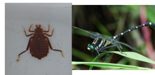
コオニヤンマ(ヤゴ)

カワトンボ系のヤゴは見分けづらい! 飛んでいるトンボを見て予想しても良いかな...? 図鑑をみながら挑戦してみよう。